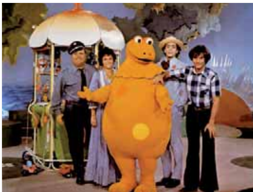
L'île aux enfants

Précurseur et innovant, Christophe Izard a su inventer la télévision pour les petits tout en les guidant de façon ludique et éducative dans un monde un peu trop grand pour eux.