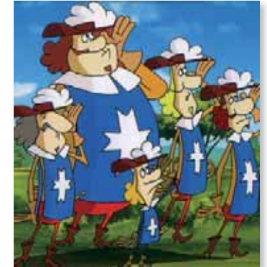
Albert le cinquième mousquetaire