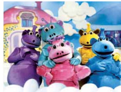
Le Village dans les nuages