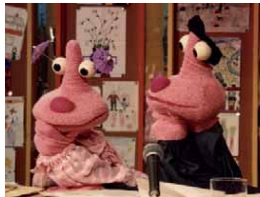
Les visiteurs du Mercredi